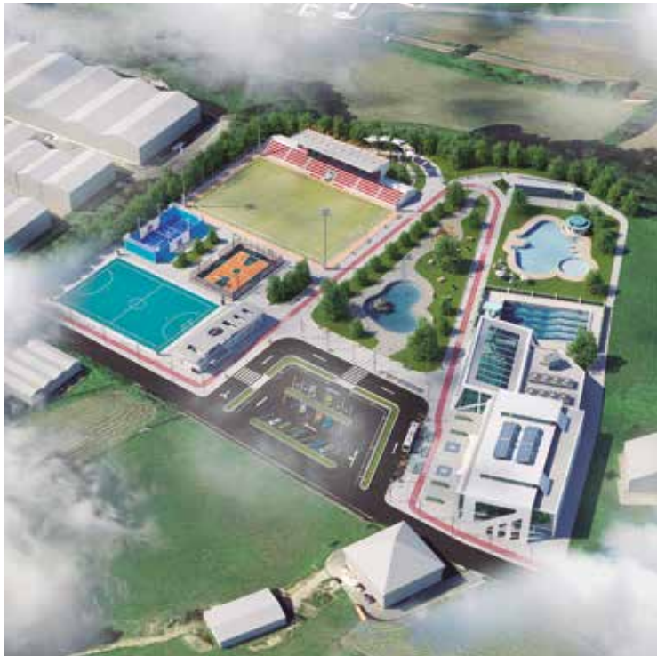
Berezaoko Korriuena gunean kokatuko litzateke kirol gune berria. EAJk aurkeztutako foto-muntaia ezkerreko irudian

Bi futbol zelai eta aire zabaleko igerilekuak izango lituzkeen kirol-hiri berria eraikitzea proposatu du EAJren udal taldeak. Berezaoko Korriuena izeneko eremuan kokatuko litzateke azpiegitura berria, Azkoagain eta Berezaio artean dagoen eremuan, jeltzaleek prentsa ohar bidez azaldu duenez.