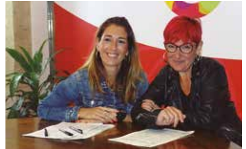
Uztailaren 8an sinatu zuten ustiapen kontratua

Araozko ostatu berriak bi solairu dauzka. Behe solairuan taberna, jantokia (40 bat lagunentzako), sukaldea eta apartamentu irisgarri bat ditu. Goiko solairuan beste hiru apartamentu.