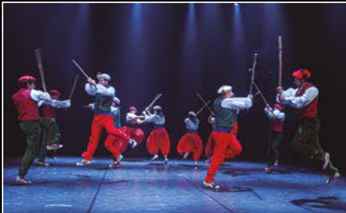
100 dantzari eta musikari, dantza dramatizatuaren inguruan