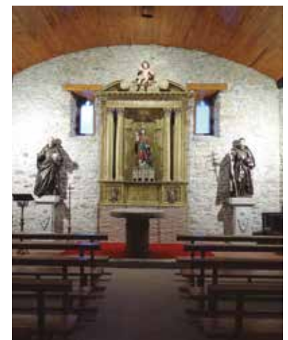
Larraña auzoekoek San Lorentzo ermitako irudiak berrituko dituzte

Otsailaren 15ean onartu ziren auzo-alkateen foroan Auzotasuna izeneko diru-atal gehigarrien oinarri arautzaileak, eta aurreneko deialdira aurkeztutako eskaerak aztertu ostean, honako laguntzak ematea onartu du Udalak: Larraña auzoari 5.228€, San Lorentzo ermitako irudi erlijiosoen eraberritze lanetarako, eta Lezesarri auzoari 2.541€, auzoko bide historikoen azterlana egiteko.