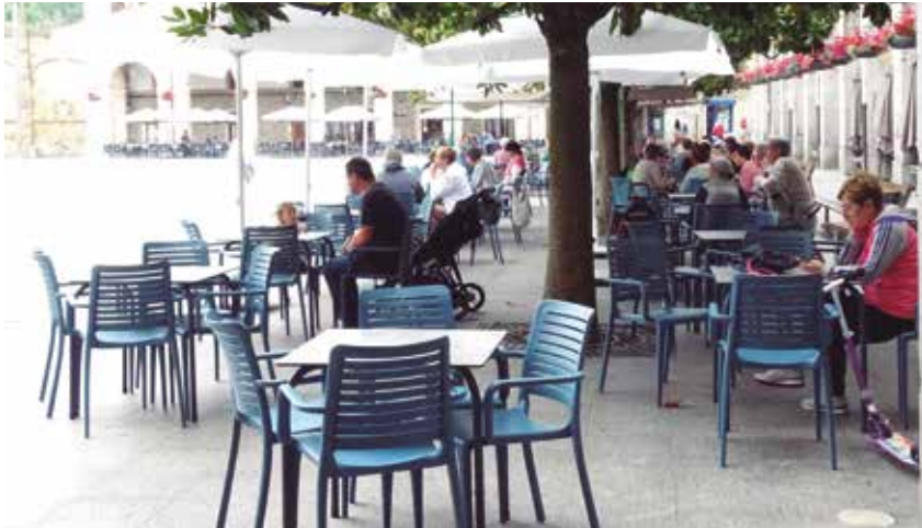
Ordenantza berrira egokitu beharko dute terrazak

2020ko maiatzaren 15ean, COVID-19ak eragindako pandemia giro betean, taberna eta jatetxe aurrealdeko terrazak handitzeko aukera ematen zuen dekretua onartu zuen udalak, osasun kontrola eta urruntze sozialari zegozkion neurriak bete eta ostalaritza sektoreari laguntzeko asmoz.