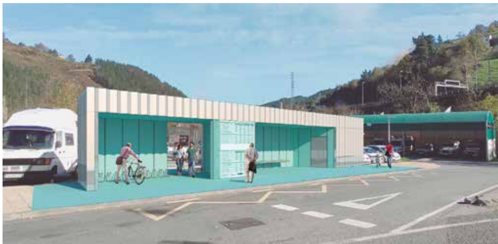
Elorregiko autobus geltokiak izango duen itxura ikus daiteke goiko foto-muntaian